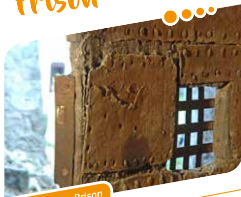
Visite Château Prison