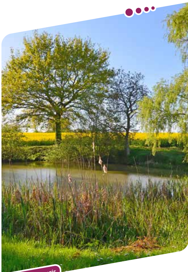
Hameau de Beauvais