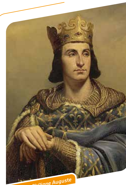
Portrait de Philippe Auguste

👥 Capacité : 10 à 30 personnes/groupe À partir de 90 €