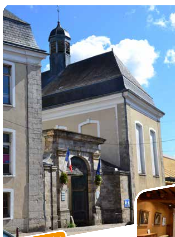
Porche de l'Hôtel-Dieu

Capacité : 10 à 30 personnes/groupe À partir de 90 €