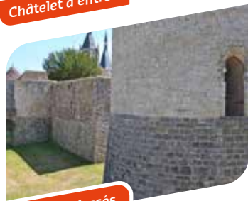
Donjon et fossés