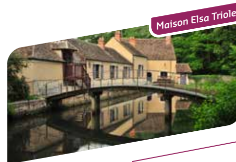
Maison Elsa Triolet

En 1951, Louis Aragon achète pour Elsa Triolet, la « russe déracinée », un petit coin de France, à Saint-Arnoult-en-Yvelines : le moulin de Villeneuve.