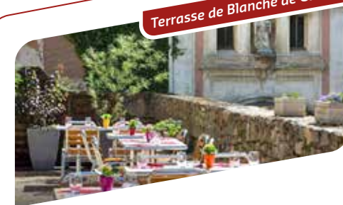
Terrasse de Blanche de Castille

Le Chef élabore sa carte au fil des saisons en portant une attention particulière au choix de produits : frais et locaux.