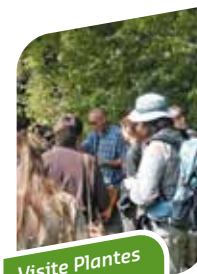
Visite Plantes sauvages