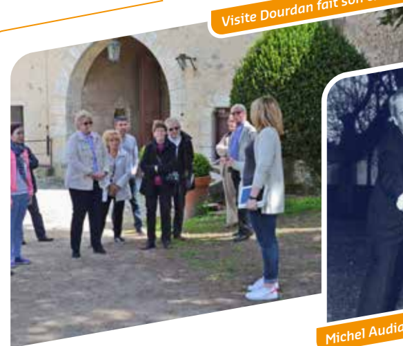
Visite Dourdan fait son cinéma