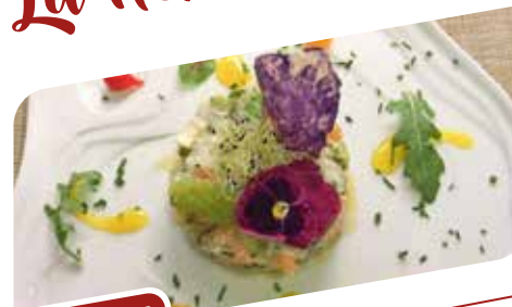
La Fleur de Sel

Au cœur de ville et à deux minutes de la gare, la Fleur de Sel est un agréable restaurant à l'ambiance conviviale comprenant un rez-de-chaussée et une salle à l'étage.