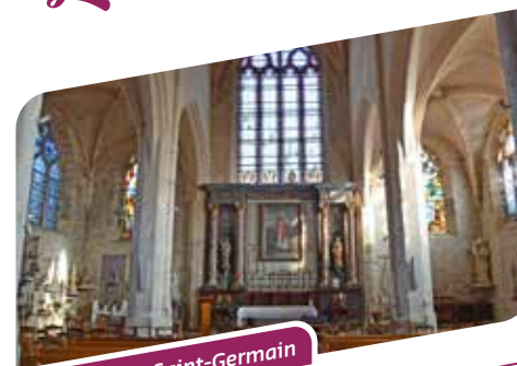
Église du Val-Saint-Germain

Commune située à proximité de Dourdan, le Val-Saint-Germain a été pendant longtemps un haut lieu de pèlerinage.