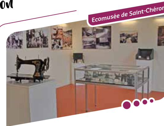
Ecomusée de Saint-Chéron

Cordonnier, menuisier, carrier, maréchal ferrant-forgeron, lavandière, etc... Tous ont rythmé la vie de la commune autrefois et sont représentés dans l'écomusée, tant par des outils ou objets que par des reproductions de photos. Venez les découvrir !