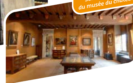
Salle Hôtel-Dieu du musée du château