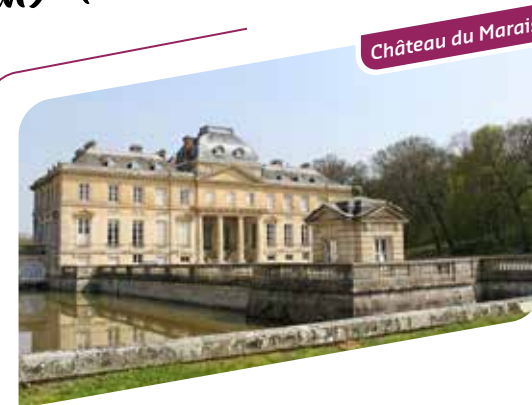
Château du Marais

Le château, mis en valeur par son miroir d'eau long de 550 mètres, est l'un des plus beaux exemples d'architecture Louis XVI. Découvrez l'histoire de ce domaine en parcourant le musée et la salle des calèches situés dans les communs et le parc.