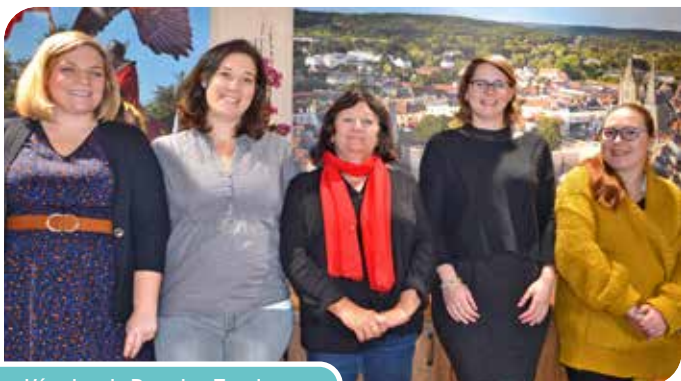
L'équipe de Dourdan Tourisme

Le Service Groupes de Dourdan Tourisme, votre interlocuteur unique, est à votre disposition pour l'élaboration de vos projets sur mesure, adaptés à vos envies.