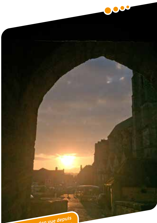
La Halle de Dourdan vue depuis le châtelet d'entrée du château