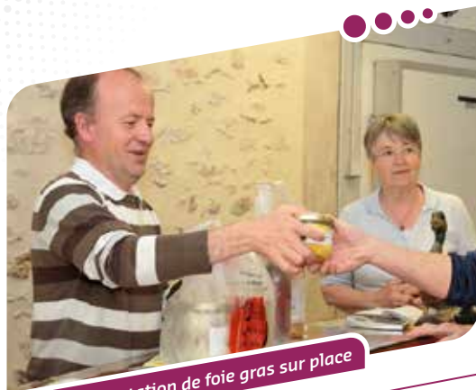
Vente et dégustation de foie gras sur place

Confits et foies gras : bienvenue à la ferme dans le charmant village de Chalo-Saint-Mars.