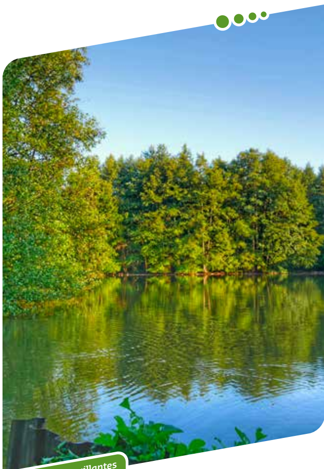
Les fontaines bouillantes