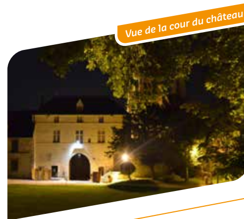
Vue de la cour du château