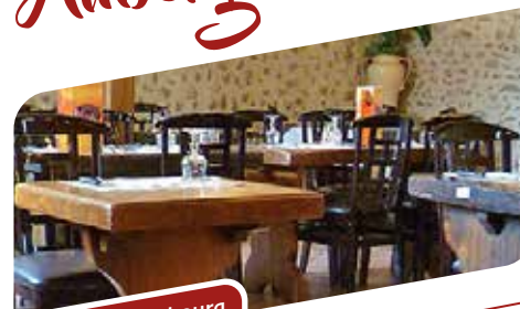
Auberge du Faubourg

Utilisée comme grange et écuries jusqu'en 1917, la Grange du Faubourg vous accueille pour un repas mêlant cuisine traditionnelle et spécialités portugaises.